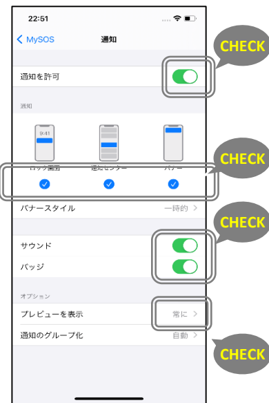
通知を許可し、プレビュー表示を「常に」にする