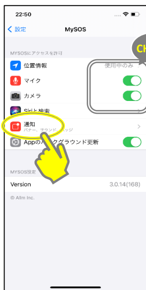
「位置情報」が「使用中のみ」または「常に」になっていること、「マイク」「カメラ」がオンになっていることを確認し、「通知」をタップ