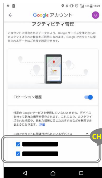
「ロケーション履歴がオン」をタップし、「このアカウントに関連づけられているデバイス」にチェックが入っていることを確認