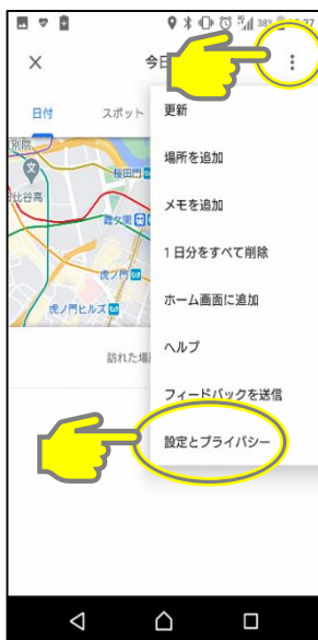
その他アイコンをタップし、「設定とプライバシー」をタップ