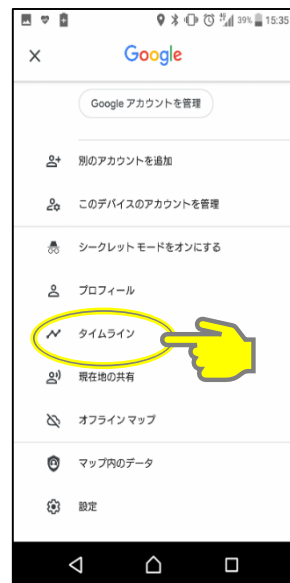
「タイムライン」をタップ