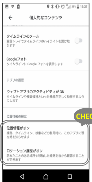
「位置情報がオン」、「ロケーション履歴がオン」になっていることを確認