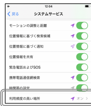
「利用頻度の高い場所」 の設定がオンになっている ことを確認