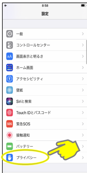
「プライバシー」をタップ