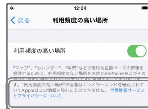
参考 「位置情報サービスと プライバシーについて」

※電波の状況等により、位置情報の精度等に影響が出る場合があります。 ※利用頻度の高い場所は、Appleが読み取ることはできません。詳しくは、「利用頻度の高い場所」 設定画面に記載の「位置情報サービスとプライバシーについて」をご覧ください。