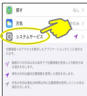
「システムサービス」を タップ